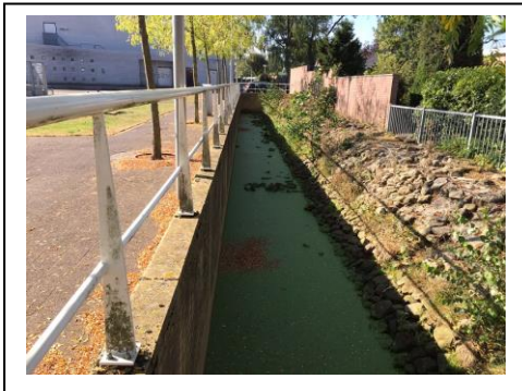
8. De Stads Regge