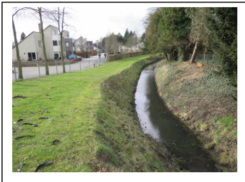
6. De Nieuwe Beek