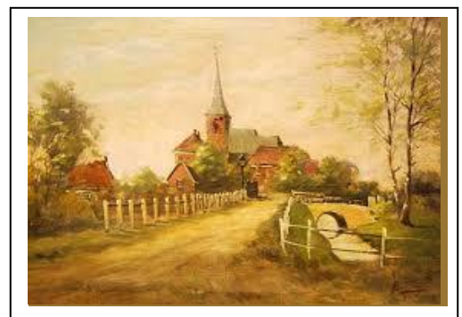
7. De Poelsbeek

Als het goed is heb je nu 8 nummers op jouw plattegrond gezet. Wanneer je niet goed weet waar alle nummers getekend moeten worden, kijk je nog even naar de Powerpoint van les 1. Die is te vinden op: http://www.cubahof.nl/aanbod/leerlijn-erfgoed/goor/